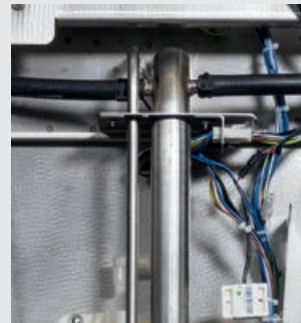
Steigleitungen aus Edelstahl