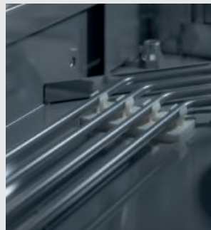
Dosierleitungen aus Edelstahl