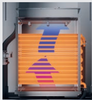
Wärmerückgewinnung MEIKO AirConcept