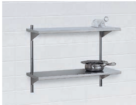
Wandregal* mit höhenverstellbaren Ablagen in allen Breiten (Tiefe 350 mm).