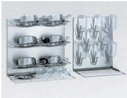
Abtropf- und Lagerregale* für desinfizierte Urinflaschen, Bettpfannen und Gefäße mit Abstellrost oder Abtropfwanne. In den Breiten 500 bis 1.400 mm.

Zusätzlich zur MEIKO Reinigungs- und Desinfektionstechnik halten wir für Sie ein umfangreiches Zubehör- und Einrichtungsprogramm für sicheres und ergonomisches Arbeiten sowie hygienisches Lagern von Pflegeutensilien bereit. Nachstehend 6 Beispiele praxisorientierter Lösungen. Gerne erarbeiten wir auch für Sie individuell geeignete Lösungsvorschläge aus. Sprechen Sie uns an. Wir sind jederzeit und gerne für Sie da.