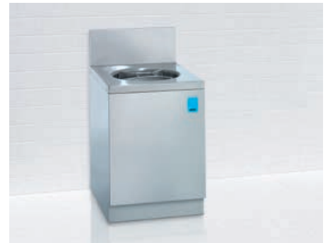
Ausguss mit eingebauter Randspülung* unabhängig vom Steckbeckenspüler bedienbar (optional). Spritzblende (optional).