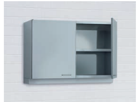
Geschlossene Wandschränke** Schränke mit Schlagtüren und jeweils 1 Zwischenboden. In den Breiten 500 mm, 600 mm, 800 mm, 1.000 mm, 1.200 mm und 1.500 mm.