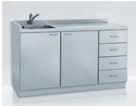
Spülkombination* Unterschränke u.a. mit Schubladen für Pflegekombinationen in unterschiedlichen Breiten und Höhen planbar.