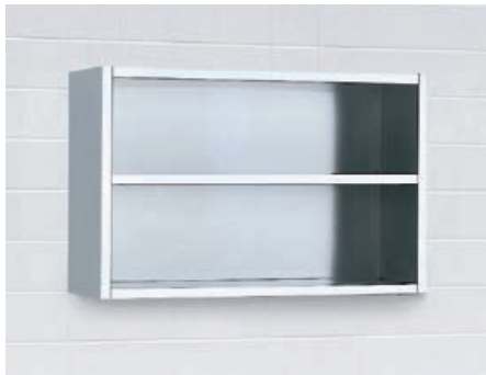
Offene Wandschränke Schränke für die offene Ablage mit jeweils 1 Zwischenboden. In den Breiten 500 mm, 1.000 mm und 1.200 mm.